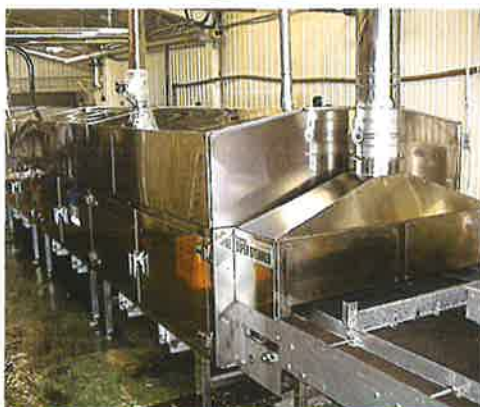
大型多目的焼成装置