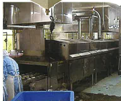
用途別専用焼成装置