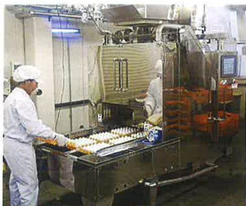
温泉卵・ゆで卵製造装置