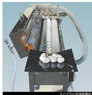
スパイラル洗浄殺菌中

※写真は戻しコンベア付のラインに直角に取り付けるタイプです。 ※各種ワーク・製造ラインに合わせて設計・製作いたします。